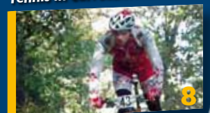
Successo per MTB notturna.