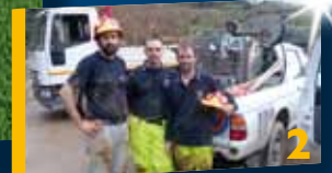
Un aiuto a Monterosso.