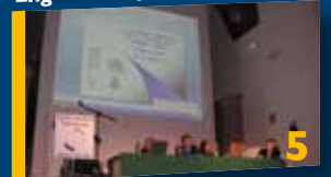
Verso l'unione dei comuni.