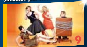
Corsi gratuiti di Teatro e Musical.