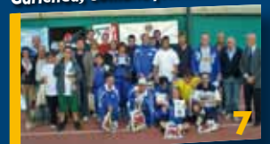
Tennis in carrozzina.