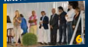
Garlenda, comune fiorito.