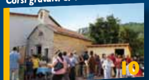
Cappella di Fuenza restaurata.