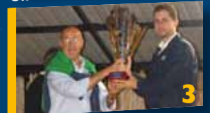
Primo trofeo a Garlenda.