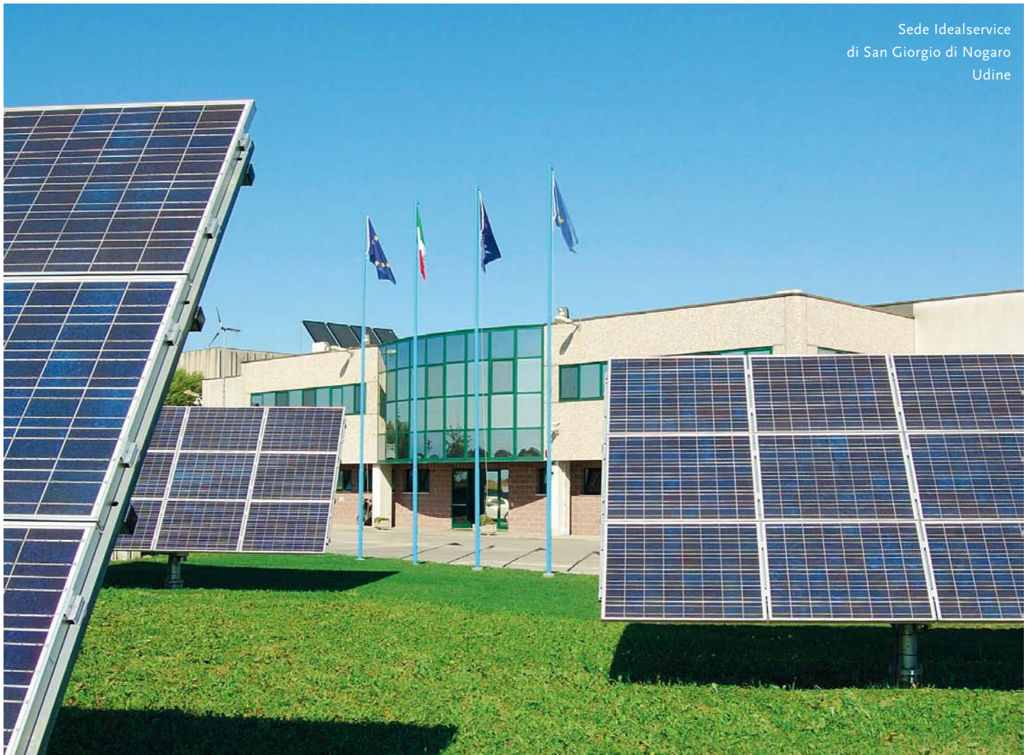
Sede Idealservice di San Giorgio di Nogaro Udine